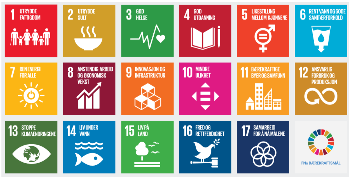
Figur 2: FN sine bærekraftsmål 1

Stad kommune vil bruke FN sine bærekraftsmål aktivt i planlegginga. Arbeidet som vert gjort nasjonalt og regionalt vil bli følgt opp.